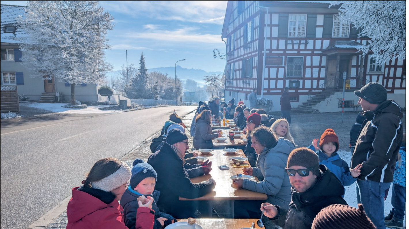
Traditionelle Neujahrssuppe bei Sonnenschein auf dem Hirschenplatz in Hohentannen