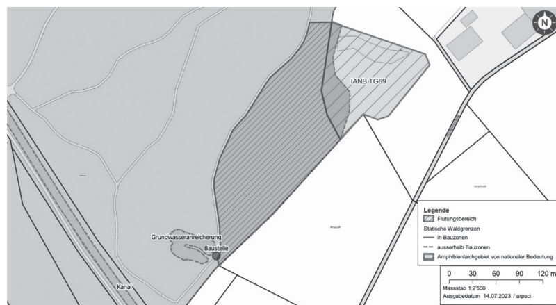
Abbildung 1: Baustellenstandort. Während der Bauphase ist der Durchgang erschwert.

Besuchen Sie uns auch unter www.sulgen.ch