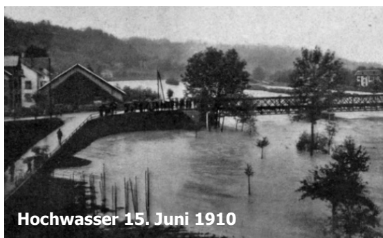
Hochwasser 15. Juni 1910