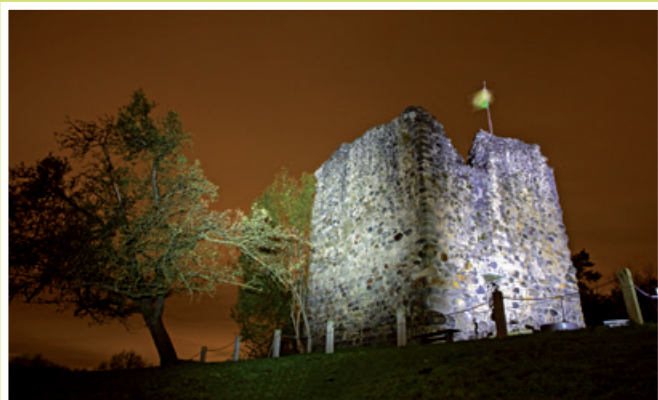
2007 Erste eigene Wandernacht auf dem Ruinenweg