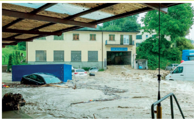
2015 Unwetter vom 14. Juni