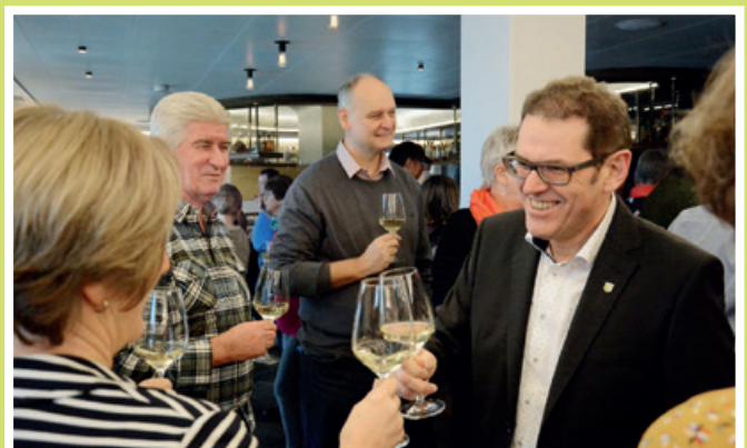
2020 Neujahrsapéro mit dem frisch gewählten Ständerat