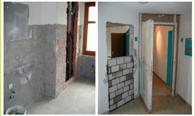
2014 Umbau Gemeindeverwaltung