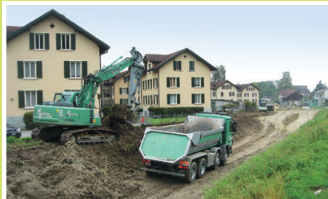
2008 Bau Hochwasserschutzdamm