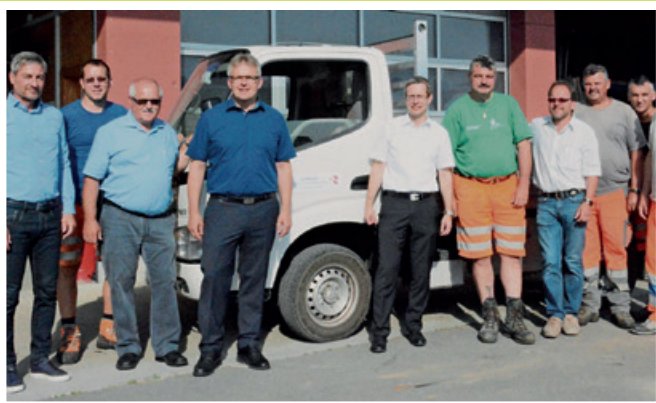
2017 Ab 01. Juli: Gemeinsamer Werkhof mit Sulgen