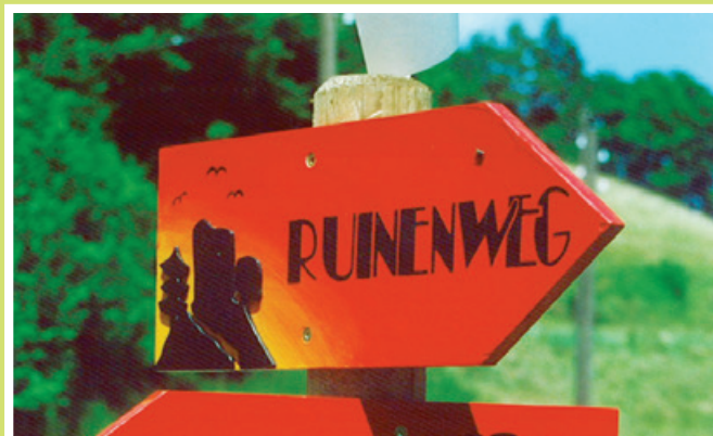
2000 Erstellung Ruinenweg