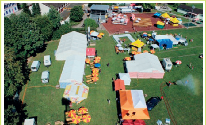
2016 Dorffest «20 Jahre Kradolf-Schönenberg»