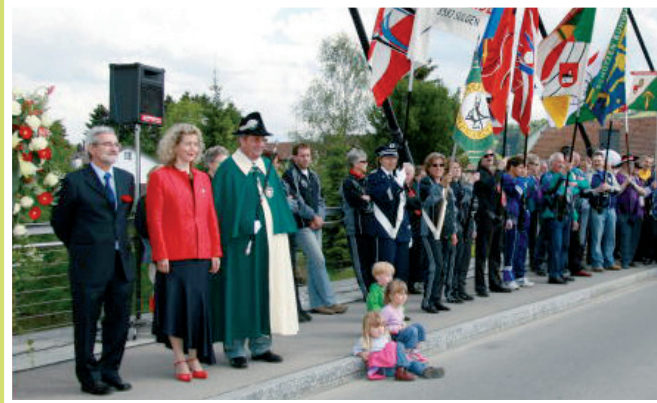
2006 Renate Bruggmann, Wahlfeier Grossratspräsidentin