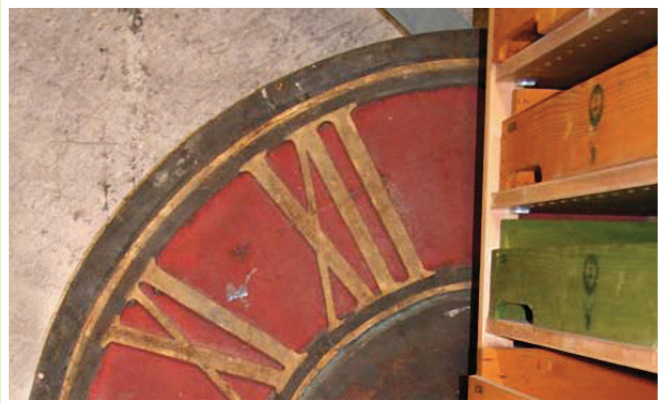
2005 Eröffnung Bauteillager Denkmalstiftung Thurgau