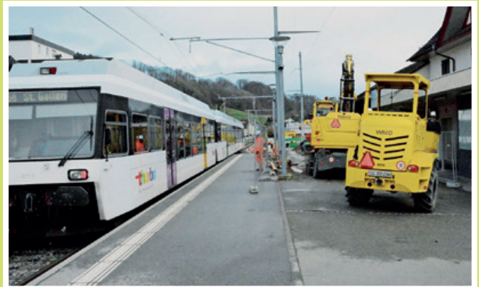
2018 Umbau Bahnhof Kradolf zur Kreuzungsstation