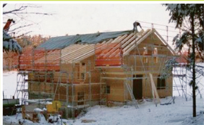
2003 Bau Schützenhaus Erlenacker