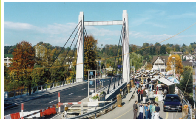
1998 Einweihung Thurbrücke