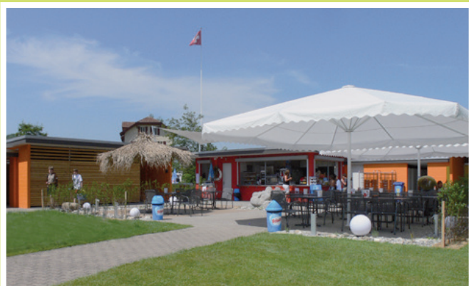
2009 Umbau/Sanierung Schwimmbad Thurfeld