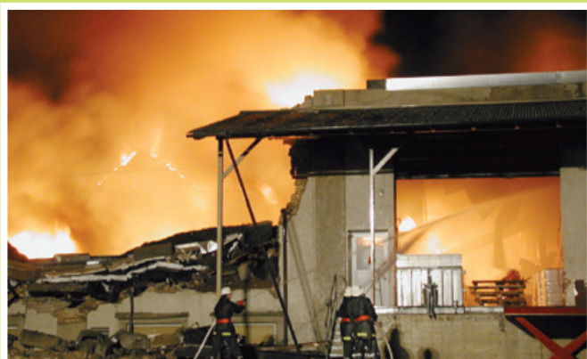
2001 Grossbrand auf dem Interparsareal in Schönenberg