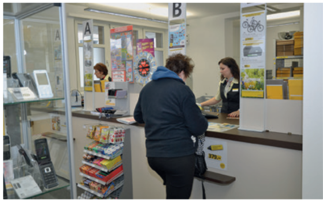
2013 Eröffnung Postfiliale im ehemaligen Bahnhofsgebäude