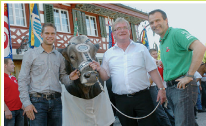
2010 Tour d'Arnold (Sponsor Hauptpreis Eidg. Schwingfest)