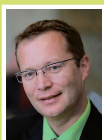
Walter Schönholzer Gemeinderat von 1996 – 2006 Gemeindepräsident von 2006 – 2016 amtierender Regierungsrat seit 2016