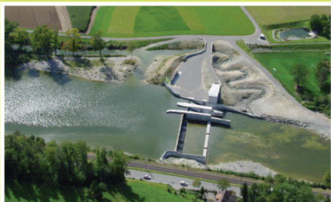
2011 Einweihung Thurkraftwerk Thurfeld, Schönenberg