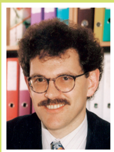
Jakob Stark Gemeindepräsident von 1996 – 2006 Regierungsrat von 2006 – 2020 amtierender Ständerat seit 2020