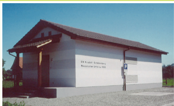
1999 Neue Mess-Station EW Unterau